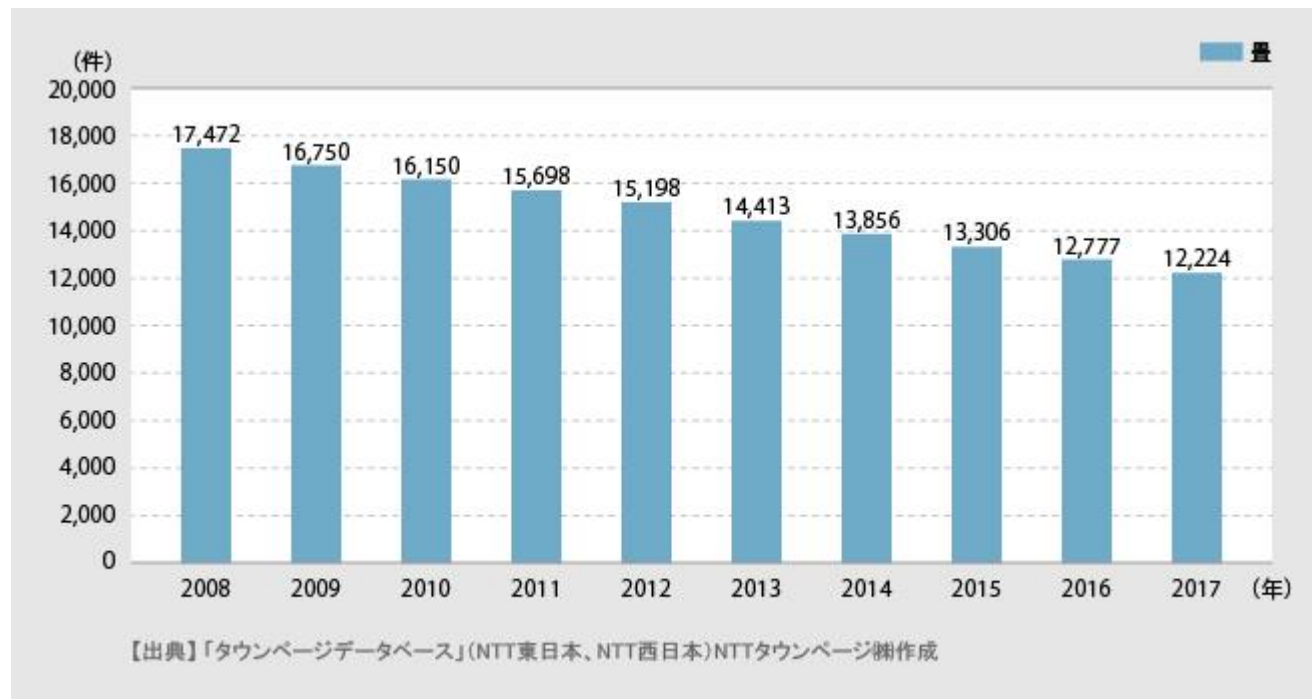
<図2> 業種分類「畳」の登録件数推移（2008年～2017年）

業種分類「畳」の登録件数は、この10年で17,472件から12,224件とゆるやかに減少していますが、和室の急激な減り方と比較すると、意外と健闘していることがわかります。やはり、畳コーナーや琉球畳など和モダンの家づくりが功を奏しているのでしょうか。